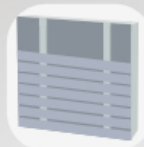
Pose horizontale simple lambourdaire