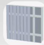
Pose verticale double lambourdaire