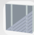
Pose diagonale simple lambourdaire